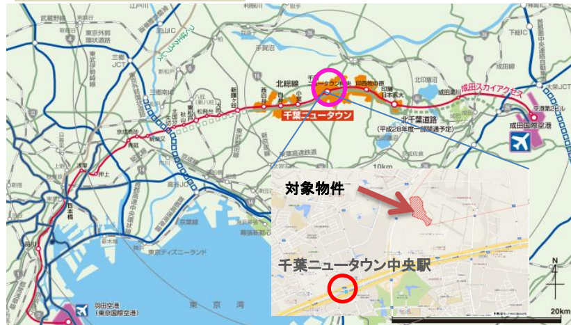
- Location Map -

※外観パース・平面図は設計段階のものであり、竣工の現況の異なる場合がございます。